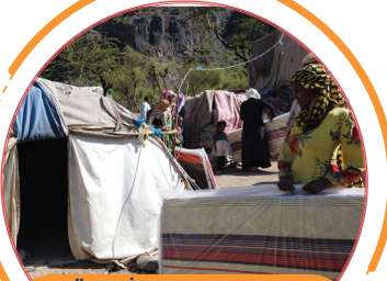
توزيع السلل الشتوية والبطانيات والفراشات لعدد ٢٢٥ أسرة