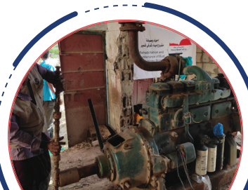
سقيا الماء وصيانة مياه مشروع شرقي شمير