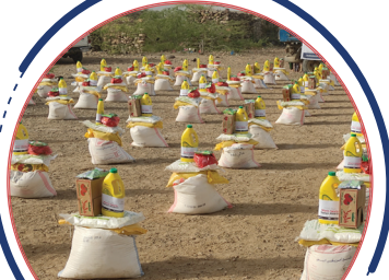
توزيع السلل الغذائية لعدد ٢٥٠ أسرة