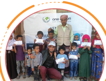
مشروع كفالة الأيتام